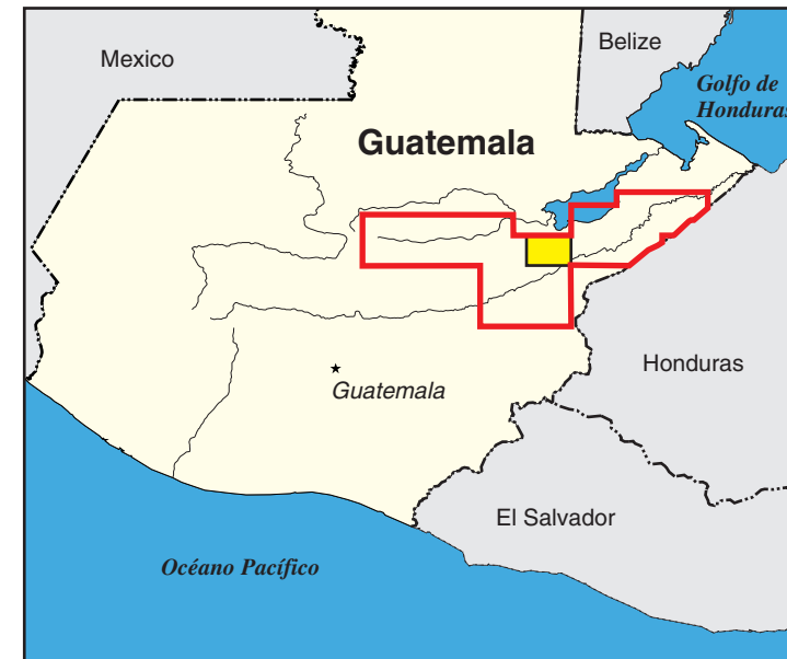
El área de trazado de deslizamientos de tierra inducidos por el Huracán Mitch a escala 1:50,000 está delineada por una línea roja. El rectángulo amarillo muestra la localización de esta hoja del mapa dentro del área de estudio.

Método de compilación Compilation method