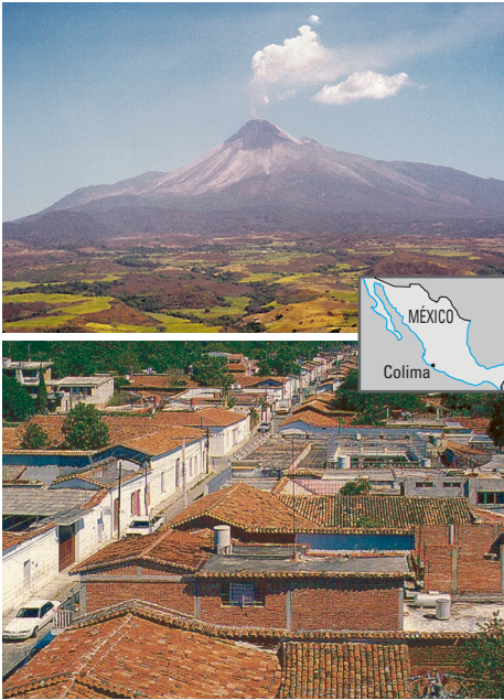
Los pueblos de Comala (foto inferior) y Cuauhtémoc, así como la ciudad de Colima (occidente de México) se encuentran al pie del Volcán de Fuego de Colima (3,860 metros de altitud) (foto superior, vista desde Cuauhtémoc). Estos centros de población están construidos sobre depósitos de enormes avalanchas de escombros que bajaron estrepitosamente y violentamente desde este volcán hace más de 2,000 años. Estas antiguas avalanchas de escombros (en color café en el mapa) viajaron sobre el terreno a más de 30 kilómetros desde la cima del volcán, inundando un área de más de 200 kilómetros cuadrados.

aerosoles son capaces de bajar varios grados centígrados (°C) la temperatura promedio del planeta por largos períodos de tiempo. Estos aerosoles de ácido sulfúrico también contribuyen a la destrucción de la capa de ozono, ya que alteran los compuestos de cloro y nitrógeno de la atmósfera alta.