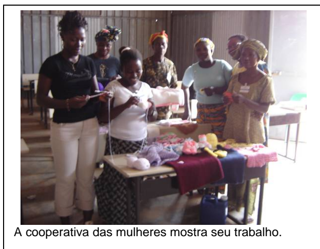
A cooperativa das mulheres mostra seu trabalho.

Com uma mudança de pessoal e um ano lucrativo, a empresa embarcou numa série de actividades sociais que tiveram início em 2004. As actividades chave centraram-se na Educação e Saúde. Foram construídas escolas e fornecidos material e energia. Água potável foi fornecida a escolas e comunidades próximas. A dieta foi reforçada com a produção de leite de soja e a sua distribuição diária às crianças locais que frequentam as escolas. A vacinação de crianças locais e testes voluntários para HIV/AIDS estão a ser realizados pela clínica da empresa, enquanto kits compostos com redes para protecção de cama estão a ser distribuídos para combater a malária.