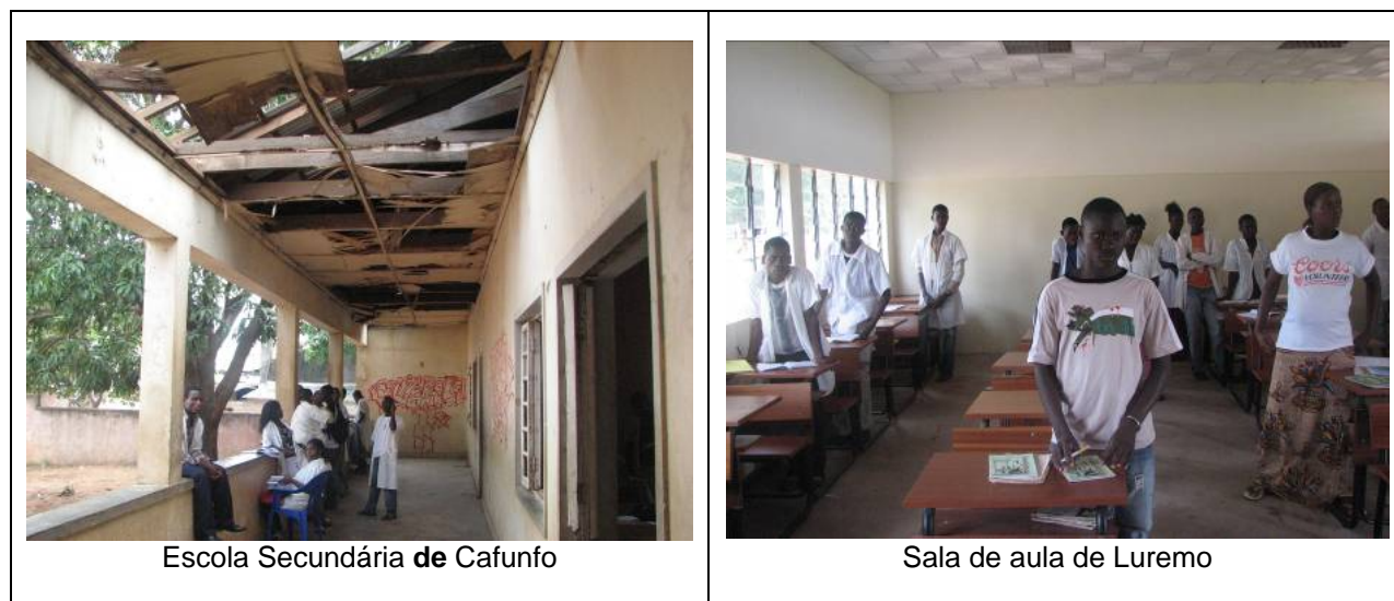
Escola Secundária de Cafunfo

Em Luremo, não há escola secundária. Actualmente, os estudantes que completam a escola primária em Luremo vão para a cidade de Cafunfo, ou outras cidades para os estudos secundários. A escola primária de Luremo tem fornecimento de água por um tanque cedido pela empresa de mineração de diamantes locais, a Luminas. Dos 948 estudantes matriculados na escola primária, 28% (266) são meninas. Um total de 3.746 estudantes está matriculado no distrito. Aproximadamente 5000 outras crianças, em idade escolar, não estão matriculadas.