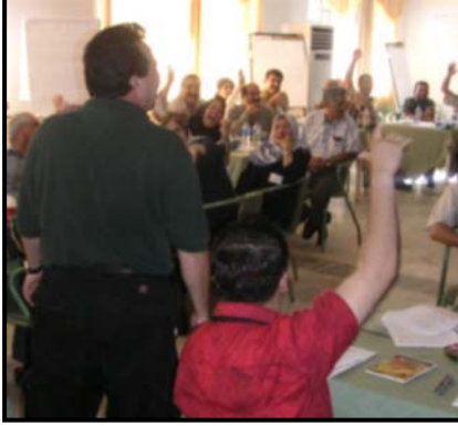
المدراء المحليون لمحافظة التأميم في جلسة تدريبية إدارية.