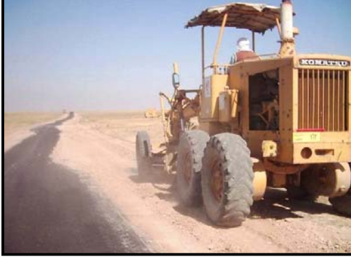
عملية تبليط شارع في محافظة نينوى.

• قامت جمعية كردية في احد المناطق الريفية في السليمانية ببناء 20 محطة توقف باص في مدينتهم و