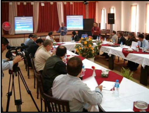
اجتماع احتفالي للمجلس الاستشاري السياحي في كردستان.

● عُقد الاجتماع الافتتاحي للجنة الاستشارية للسياحة في كردستان في منطقة حكم كردستان في الهيئة العامة للسياحة . و حضر الاجتماع اكثر من 12 قائد محلي من مختلف القطاعات السياحية الخاصة و العامة و كذلك ممثلين من برنامج الحكم المحلي للوكالة الامريكية للتنمية الدولية. و ستعمل هذه اللجنة كمؤسسة استشارية رئيسية لتنفيذ المبادرات المستقبلية في القطاع السياحي و هي مهمة جداً باعتبارها جزء من استراتيجية تطوير الاقتصاد في كردستان التي طورها الحكم المحلي لكردستان و برنامج الحكم المحلي للوكالة الامريكية للتنمية الدولية.