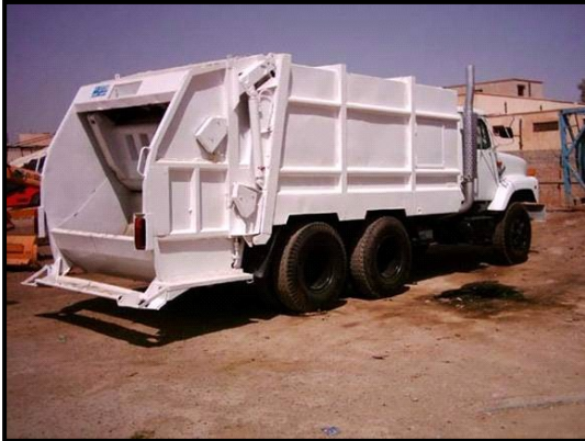
تم توفير مركبات جديدة للنفايات الى بلدية محافظة ديالى لتحسين عملية جمع النفايات والاساخ.