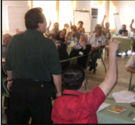
المدراء المحليون لمحافظة التأميم في جلسة تدريبية أدارية.

تساعد الوكالة الامريكية للتنمية الدولية USAID الشعب العراقي في إعادة اعمار وطنهم عن طريق العمل مع الحكومة العراقية المؤقتة ، ويتم تنفيذ برامج الوكالة الامريكية للتنمية الدولية بالتنسيق مع الامم المتحدة UN ودول التحالف المشتركة والمنظمات غير الحكومية (NGOs) وشركاء القطاع الخاص . ومهمة الوكالة الامريكية للتنمية الدولية USAID في العراق تتضمن توليها برامج في مجال التعليم والرعاية الصحية والأمن الغذائي وإعادة اعمار البنى التحتية وانعاش الاقتصاد ومبادرات تطوير المجتمع والتنسيق بين المؤسسات الحكومية ومبادرات الانتقال .