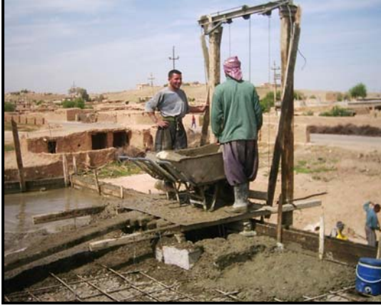
اعمار مدرسة في محافظة السليمانية.