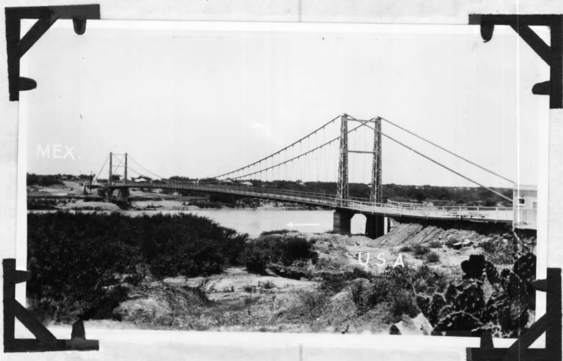
Puente Colgante Sobre el Río Bravo Entre San Pedro de Mier, Tamps., y Roma, Texas.