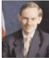
ROBERT B. ZOELICK

Ministro de Comercio Internacional Canadá