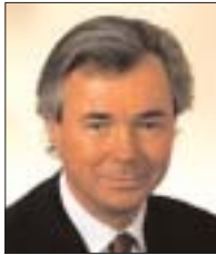
PIERRE S. PETTIGREW

Ministro de Comercio Internacional Canadá