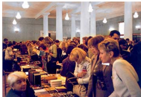
Книжная выставка в Великом Новгороде привлекла много читателей

Петербург с момента своего основания, как столица Российской империи, был одним из книжных центров страны. В 18-20 вв. здесь издавалось две трети всей ее книжной продукции. В настоящее время Петербург является вторым книгоиздательским центром России. По самым приблизительным подсчетам, в городе работает более 800 книготорговых организаций и книжных издательств. В связи с тем, что уже на протяжении трех лет не проводится государственное лицензирование издающих организаций, трудно определить не только ассортимент, но и факт существования самого издательства. Целый ряд издательств полностью вывозит свои тиражи за пределы города. Но и то, что появляется на прилавках, библиотекам отслеживать очень сложно. По не зависящим от библиотек причинам в Петербурге нет местного закона об обязательном экземпляре. Даже Российская национальная библиотека не получает около 30% объема местного книгоиздания.