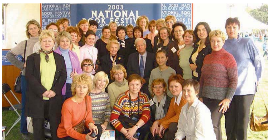
Д-р Биллингтон с супругой в окружении делегатов программы «Открытый мир» на фестивале

Джеймс Биллингтон Директор Библиотеки конгресса Председатель Совета попечителей центра «Открытый мир»