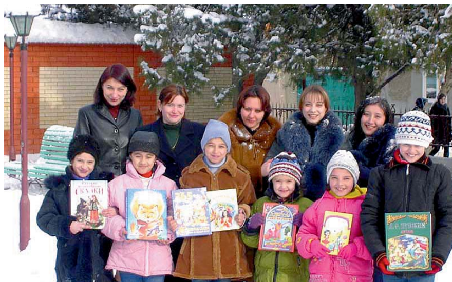
Дети беженцев на празднике, устроенном библиотекарями Хасавюрта

Столкнувшись лицом к лицу с терроризмом (у здания центральной городской библиотеки нелюди уже дважды взрывали начиненные смертью автомобили), библиотеки Хасавюрта инициировали различные активные действия, направленные на достижение согласия между неоднородными социальными группами посредством вовлечения горожан в процесс решения муниципальных проблем. Библиотеки стимулировали сетевое и межсетевое взаимодействие местных общественных организаций. Опыт показал высокую эффективность объединения разрозненных прежде усилий для решения ключевых задач. Библиотеки сумели привлечь к работе над своими проектами подготовленных специалистов, в результате чего удалось наладить реальный конструктивный диалог с властями. Установленные при этом партнерские отношения, накопленные информационные, материальные и кадровые ресурсы позволили перейти на более высокий содержательный и