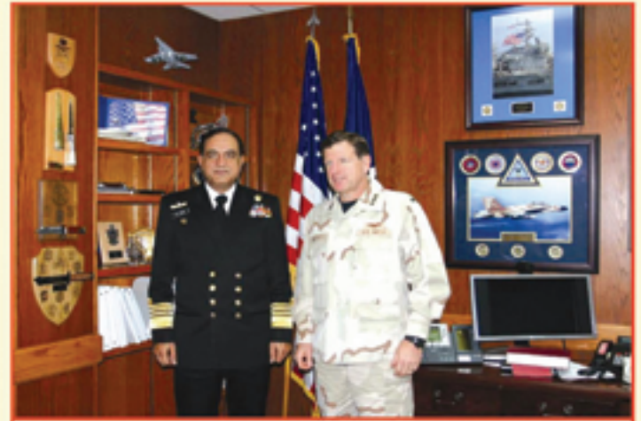
الأميرال فضل طاهر ونائب قائد القيادة المركزية للإدارة ديفيد نيكولز

قال الأميرال بأن باكستان تتطلع قديماً إلى تولي قيادة قوة المهام البحرية المشتركة ١٥٠ مرة أخرى في ٧ أغسطس. وختم بالتوكيد على أنه تمثيلاً مع سياسة الحكومة، ستواصل القوات المسلحة الباكستانية بنشاط المشاركة في الحرب العالمية على الإرهاب وعمليات الأمن البحري على الرغم من مصادرها المحدودة.