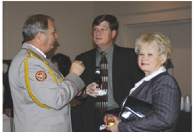
زيارة بعض وسائل الإعلام العربية التي تزور القيادة المركزية الأمريكية