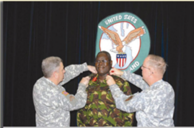
الفريق جون أبي زيد (يسار) والتواء جيرالد ميني بريهان كبير مندوبين الوطنيين

أمنة في كينيا على وجه الخصوص. يأتي إسهام كينيا في هذا الجهد على شكل الاشتراك في المعلومات ومنح الولايات المتحدة حقوق الطيران فوق كينيا وتقديم تسهيلات والاتصالات الدبلوماسية ودعم عمليات التحريم البحرية في القرن الإفريقي. لقد بقيت كينيا منمكة في الحملة ضد القرصنة في سواحلها ومياها الإقليمية في تعاون وثيق مع حلفاء آخرين في القوات البحرية. كينيا هي الآن وستكون منمكة في ضمان استقرار الصومال والقرن الإفريقي للكبير. وأن المنطقة