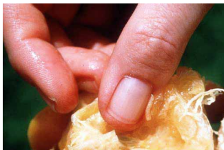
Albaricoque infestado con larvas de la mosca de la fruta.