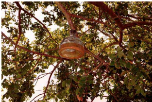
La trampa McPhail.