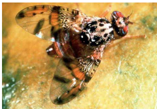
Mosca de la fruta del mediterráneo adulta.

El Servicio de Inspección de Sanidad Agropecuaria (APHIS, siglas en inglés) del Departamento de Agricultura de los EE.UU. (USDA, siglas en inglés) y el Departamento de Agricultura y Servicios al Consumidor de Florida (FDACS, siglas en inglés) necesita de su ayuda para prevenir y minimizar los brotes de las moscas exóticas de la fruta. Las moscas de la fruta presentan un riesgo significativo a la agricultura y a los recursos del medio ambiente de los EE.UU. Además de atacar a los árboles de naranja y toronja (pomelo) que comúnmente se encuentran en las huertas o en traspatios a través de Florida, las moscas de la fruta atacan a más de 250 diferentes variedades de frutas, nueces, y verduras.