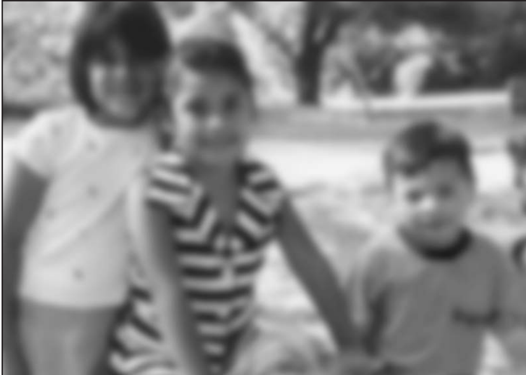
La misma imagen vista por una persona con cataratas