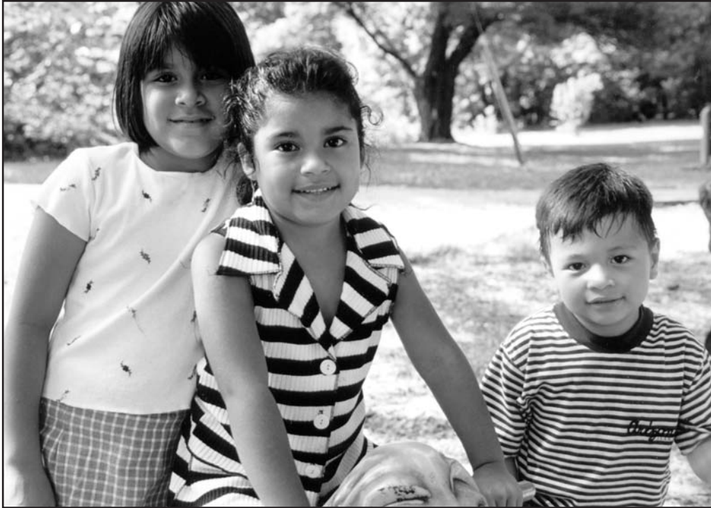
Imagen vista por una persona con visión normal