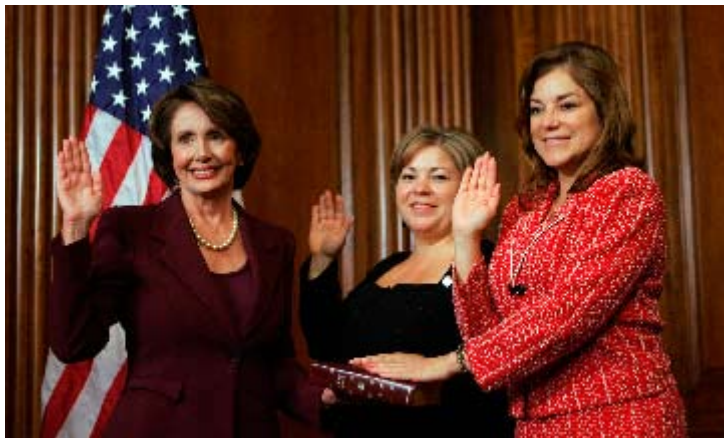
La presidenta de la Cámara de Representantes Nancy Pelosi (izq.) toma juramento a dos hermanas, Linda (centro) y Loretta Sánchez, ambas elegidas para la Cámara por California.

Dentro del Congreso, la disciplina partidista es menos estricta en el sistema estadounidense que en los sistemas parlamentarios. Es muy fácil que los miembros del Congreso voten las políticas como les plazca e incluso que lo hagan del modo más conveniente para promover su propia reelección. A causa de esto, los líderes del Congreso tienen que formar una coalición ganadora, reclutando a uno por uno de los congresistas, porque no pueden contar con el apoyo automático que les brindaría un partido altamente disciplinado. A causa de esto, una victoria legislativa en el Congreso nunca es fácil de obtener. Así, las elecciones al Congreso son importantes para la nación porque esa institución es poderosa y difícil de predecir, y lo mismo se aplica a cada uno de sus miembros.