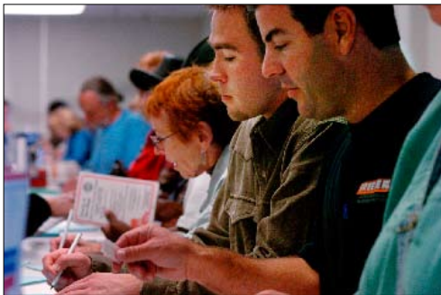
Estos votantes llenan formularios antes de emitir sus sufragios en San Diego en 2004.

T odos los años pares se realizan elecciones para algunos cargos del gobierno federal y para la mayoría de los cargos de los gobiernos estatales y locales de este país. Algunos estados y varias jurisdicciones locales convocan a elecciones en años impares.