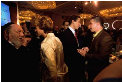
El político de Nueva York Andrew Cuomo (al centro) charla con sus partidarios en un acto para recaudar fondos durante su campaña como aspirante a gobernador.

desde temprano el día de la elección, brindan a expertos y científicos políticos detalles valiosos de cómo han votado ciertos grupos demográficos específicos y qué razones han expresado para votar así.