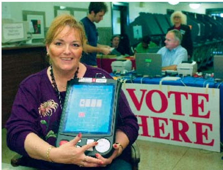
Una empleada electoral muestra un nuevo dispositivo para votar en Austin, Texas.

certificar la elegibilidad de los candidatos, registrar a los votantes elegibles y preparar las listas de electores; escoger el equipo para los comicios y diseñar las papeletas de votación; organizar una numerosa fuerza de trabajo temporal para administrar la votación el día de la elección y, finalmente, contar los votos y certificar los resultados.