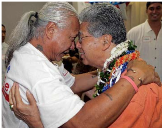
El senador Daniel K. Akaka (demócrata) por Hawái (der.) saluda en la forma tradicional a un partidario, en las oficinas generales de su campaña en Honolulu.

En virtud de la amplitud de sus bases socioeconómicas de apoyo electoral y por la