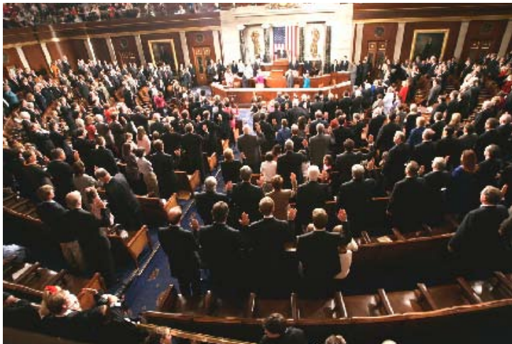
Miembros del Centésimo Noveno Congreso prestan juramento al ocupar sus escaños en la Cámara de Representantes, en la colina del Capitolio, en 2005.

distrito de votación) gana la elección. Aun cuando en unos cuantos estados se exige una mayoría de votos para ganar la elección, casi todos los aspirantes a cargos públicos pueden ser elegidos con una pluralidad simple.