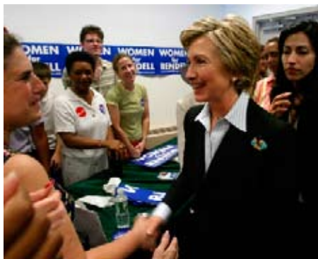
Superior: El aspirante a ser candidato presidencial republicano en 2008, Rudolph Giuliani, firma autógrafos en Bluffton, Carolina del Sur. Inferior: La aspirante a candidata presidencial demócrata Hillary Clinton (2008) visita a sus partidarios en Narbeth, Pennsylvania.