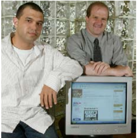
La Internet se usa cada día más para recaudar fondos y para atraer la atención hacia los candidatos que tienen pocas probabilidades de éxito. Un candidato de Ohio al Congreso (der.) y su director de comunicaciones (izq.) posan aquí mostrando su página blog.

Además, en algunas partes del país los estados colaboran