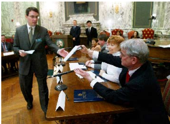
Aquí vemos cómo el colegio electoral del estado de Washington emite sus 11 votos a favor del candidato presidencial demócrata John Kerry en 2004.

Los fundadores de la nación idearon el sistema del Colegio Electoral como parte de su plan para que el poder fuera compartido por los estados y el gobierno nacional. Con el sistema