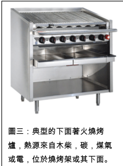
圖三：典型的下面著火燒烤爐, 熱源來自木柴, 碳, 煤氣或電, 位於燒烤架或其下面。

在通過規則之後的六個月開始, 建議規則將禁止出售、提供銷售、和安裝除高效能過濾器之類型一罩過濾器, 水洗罩或使用筒型過濾器者可予豁免。餐館在更換類型一罩或用抽氣扇作為類型一罩時需要安裝高效能過濾器。