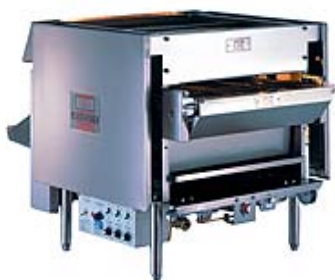
圖一：典型的鏈驅動燒烤爐，自動將食物從上面的火爐移到下面的火爐。

餐館烹調設備排放有害的混合物，危及公眾健康。餐館排放的混合物，形成臭氣和微粒，污染體超出灣區健康空氣質素的標準。餐館排放同時包括乙醛、有機酸、酒精、氮和硫磺混合物，以及多環芳烴（PAHs）。吸入這些空氣污染物可能會損害肺部組織和呼吸道，也可以導致鼻和喉嚨不適、支氣管炎、和喘氣。