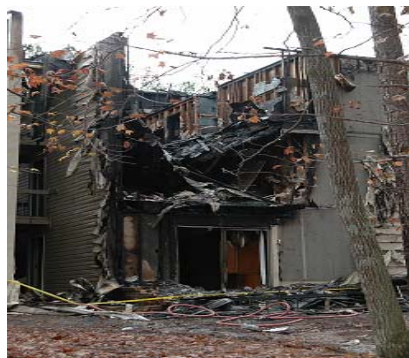
Cedar Brook Apartments 3641 Long Trail Drive Hoover, Alabama el 12/06/2005