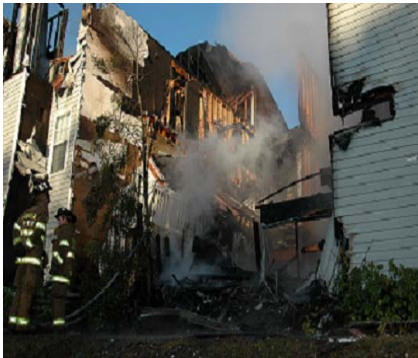
Woodgarden Apartments – Edificio #5 2139 Rocky Ridge Ranch Road Hoover, Alabama el 11/28/2005.

Se ofrece una recompensa de $10,000 para información que resulta en el arresto de la(s) persona(s) responsables por los incendios premeditados en tres edificios de apartamentos en Hoover, Alabama. Los incendios ocurrieron el 28 noviembre y el 6 de diciembre de 2005 y el 8 de febrero de 2006 en las siguientes direcciones: