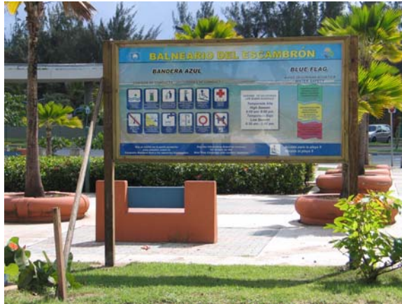
Information and Environmental Education