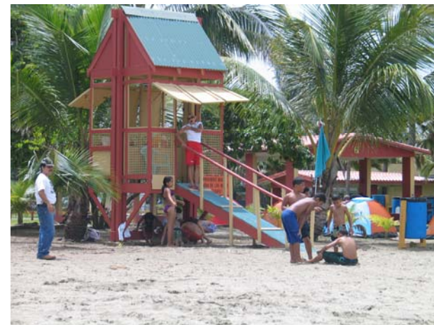
Safety and Services